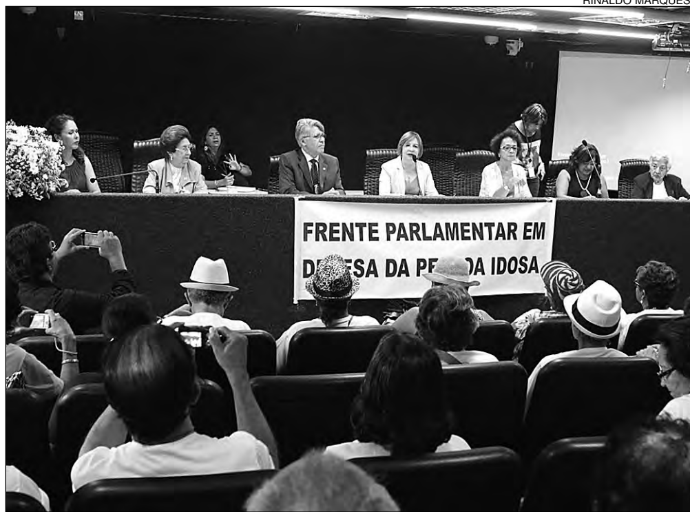
ATUAÇÃO - Frente Parlamentar em Defesa da Pessoa Idosa promove discussões sobre o tema

A Frente Parlamentar é um grupo suprapartidário formado com o objetivo de aprimorar a atuação do Poder Legislativo sobre determinada demanda da população ou setor da sociedade. O colegiado tem diversas atribuições. Entre elas, incentivar e promover debates, audiências públicas e eventos relativos ao tema representado pelo grupo.