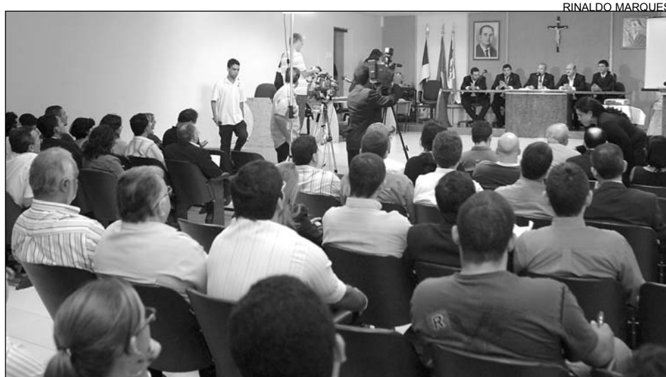
QUEIXA - Comissão de Desenvolvimento Econômico ouviu empresários insatisfeitos