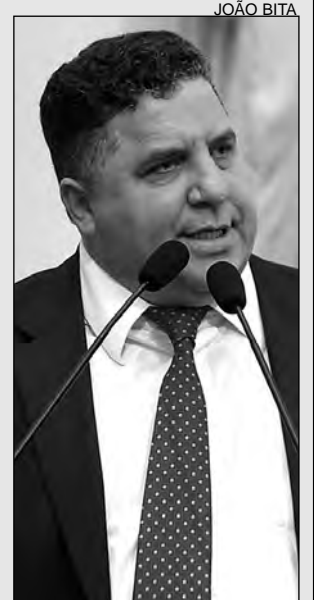
ABORDAGEM