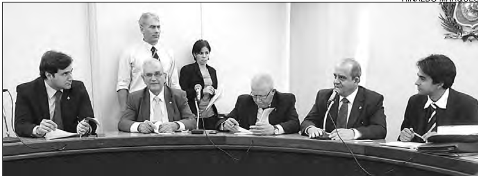
ENCONTRO - Pela manhã, Administração Pública emitiu parecer favorável