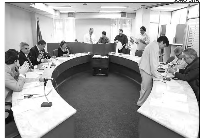
FIFA - Medida integra exigências da Federação Internacional

Fluvial de Petrolina S.A, e o Projeto de Lei Complementar nº 1.658/10, que trata da competência funcional das 1ª e 2ª Varas da Infância e Juventude, da Comarca da Capital. Os textos são, respectivamente, do Poder Executivo e do Poder Judiciário.