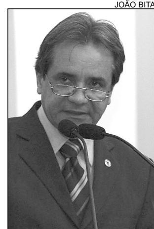
SANTANA - História

“Em 1932, realizou o primeiro projeto paisagístico