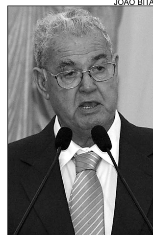
IMPACTO - Coelho

No próximo ano, a Feira será em Petrolina. “A Fenagri é um centro de comércio e debates direcionados à agricultura mundial. Na programação, seminários, simpósios, minicursos, oficinas e encon-