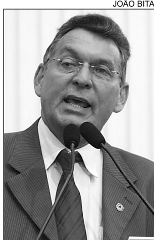
PEREIRA - Pernambuco

A Jornada Nacional de Luta em Defesa da Reforma Agrária e contra a Crise, promovida pelo Movimento dos Trabalhadores Sem Terra (MST), reuniu, em Pernambuco, cerca de 2.500 agricultores provenientes de acampamentos e assentamentos. O grupo seguiu em marcha do município de Pombos, na Zona da Mata, até o Palácio do Campo das Princesas, na Capital. A mobilização teve início, na última segunda-feira, em 20 Estados do País.