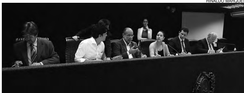
JUSTIÇA - Comissão aprovou outros seis projetos, incluindo um sobre violência das torcidas

O objetivo é evitar a poluição urbana e estimular a proteção do meio am-