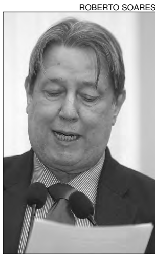
AUTOR – Eduardo Porto

De acordo com Porto, o projeto determina a destinação para mulheres de um vagão por composição no horário de pico, quando há su-