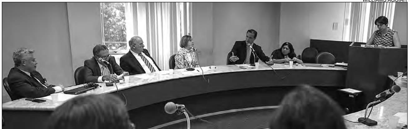
AUDIÊNCIA PÚBLICA – Representantes da Facepe, da Secretaria de C&T e de universidades participaram da reunião