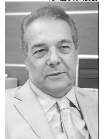
UCHOA E CABRAL - Presidente e procurador-geral da AL