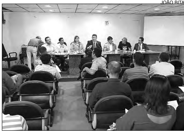
RECIFE - Encontro ocorreu na Câmara de Vereadores

O texto está sendo apreciado no Senado, onde sofreu modificações. O substitutivo ao PLC já foi aprovado na Comissão de Assuntos Sociais e, atualmente, tramita na