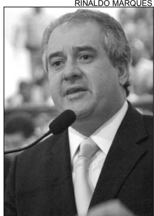
ELOGIOS - Coutinho

O líder democrata na Alepe frisou que a legislação estadual de sua autoria trouxe vários avanços