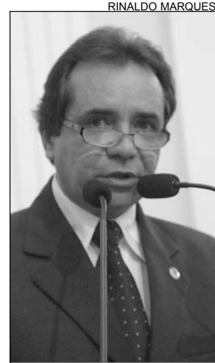
LUCRO - Pernambuco

O parlamentar salientou que é favorável a implantação do Pólo Turístico, mas afirmou que é indispensável o investimento em infraestrutura básica. "Saneamento, abastecimento d'água, pavimentação, drenagem do sistema viário e preservação do meio ambiente são essenciais."