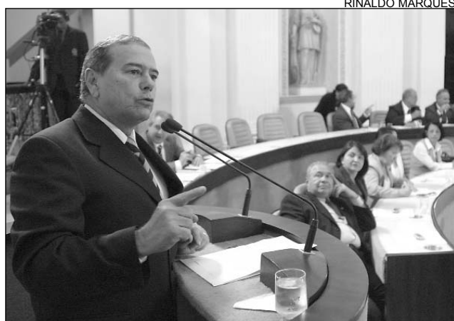
LULA - Romário Dias propôs apoio formal ao Governo

"O presidente Evo Morales tentou diminuir a importância do Brasil. Mas o