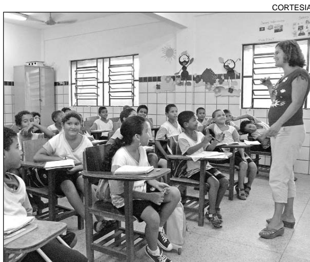
BENEFÍCIO - Obra vai atender cerca de dois mil alunos

"Considero o esporte um instrumento de inserção social, que contribui com o desenvolvimento físico e mental dos cida-