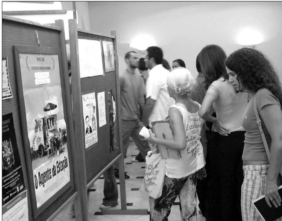
BARATO - Idéia visa estimular e facilitar o acesso a espaços culturais como cinemas