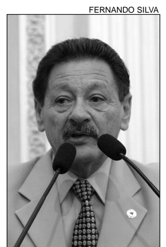
CORONEL - Elogios

O parlamentar frisou, ainda, que o prefeito está lutando pela execução das ações que vão recuperar a calha do Rio Capibaribe, in-