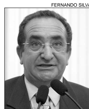
VIABILIDADE - Bringel

Bringel disse que o cultivo da cana necessita de cer-