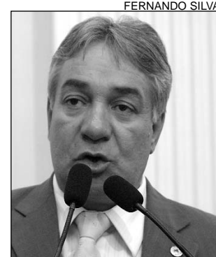
AÇÃO - Poder Executivo