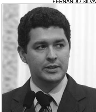
CABO - Beneficiado

O anúncio da publicação do edital de licitação para as obras que irão interligar a Barragem de Pirapama ao sistema adutor de Gurjaú, feito pelo governador Mendonça Filho (PFL), foi registrado, ontem, pelo deputado Betinho Gomes (PPS). De acordo com o parlamentar, as obras beneficiarão a população da