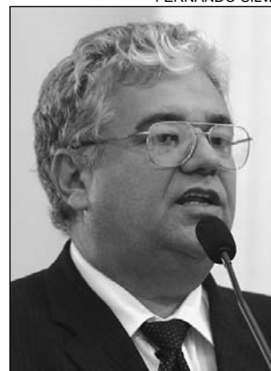
MORAES - Providências

tinados ao Fundo Especial de Registro Civil do Estado (Ferc-PE). O Fundo tem o objetivo de compensar a gratuidade, definida pela legislação federal, das certidões de nascimento, óbito e casamento para pessoas carentes. O deputado ainda pediu à população que peça recibos pelas segundas vias, no caso de o pagamento ser maior que o estabelecido. "É importante que essas pessoas nos procurem na Comissão de Finanças", salientou.