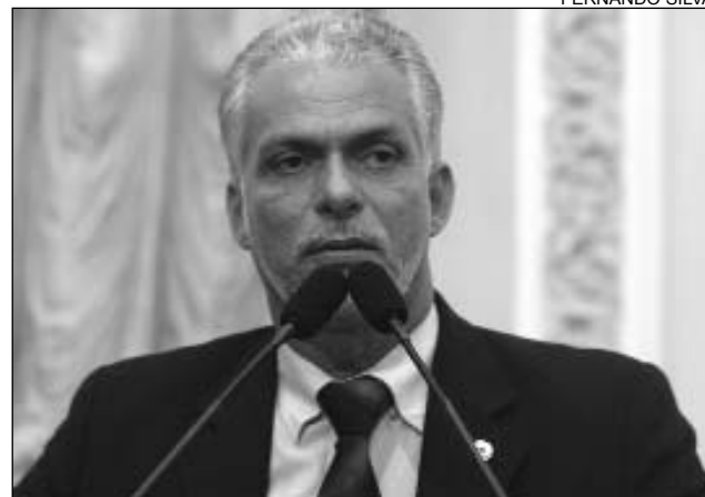
SOCIEDADE - Deputado disse que população deve se unir

O parlamentar ainda comemorou a decisão do juiz da 3ª Vara da Justiça Federal em Pernambuco, Manoel Erhardt, de ratificar o percentual de 7,4% para o ano de 2005, divulgada na semana passada. Em maio do ano passado, o magistrado concedeu uma liminar definindo o mesmo percentual, mas o Supremo Tribunal