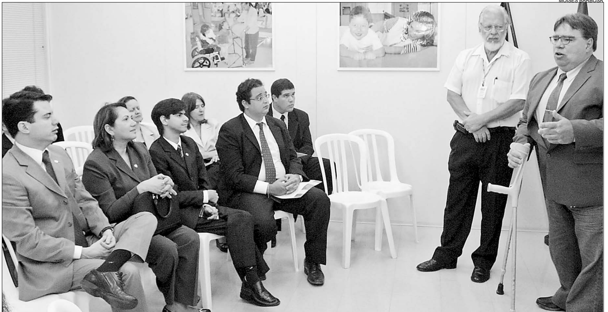
PERSISTÊNCIA - Colegiado visitou, em outubro, a unidade da Associação de Assistência à Criança Deficiente (AACD), localizada na Ilha Joana Bezerra, no Recife