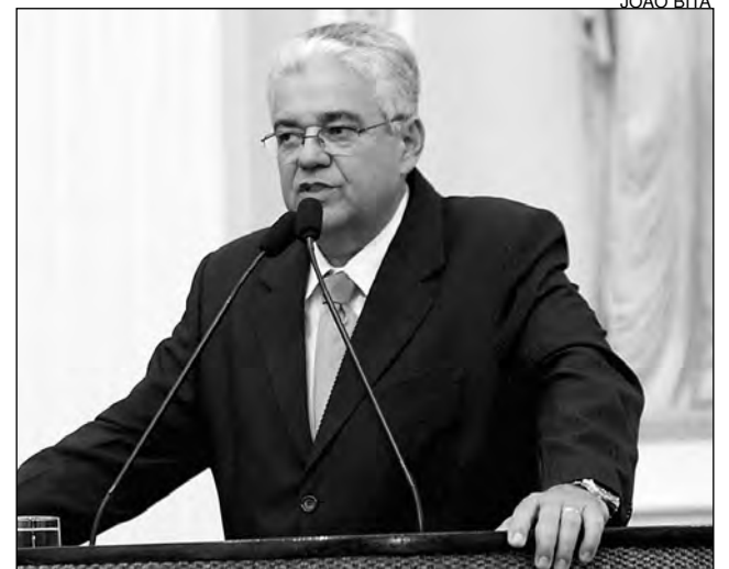
CONTRATO - Banco ofereceu R$ 700 milhões para Estado

A instituição executará o pagamento de cerca de 218 mil servidores ativos, aposentados e pensionistas. O contrato do Bra-