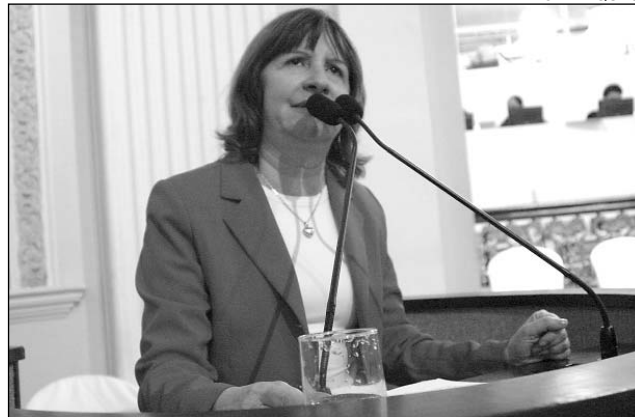
TUCANA - Senador Jarbas tem recebido mensagens de apoio

que ainda responde a processos no Conselho de Ética do Senado. "Vários jornalistas também registraram a atuação independente de Jarbas Vasconcelos e Pedro Simon e consideraram que a decisão revela o grau de manipulação exercido por Renan Calheiros", frisou, elogiando o pronunciamento do deputado João Negromonte (PMDB), na última segunda-feira, quando ele leu nota divulgada pela legenda estadual repudiando o fato.