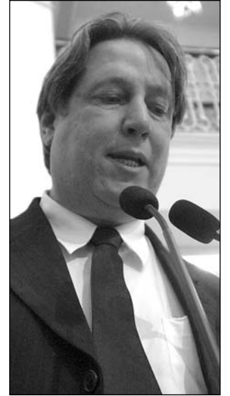
DEPUTADO - Elogios

Para solucionar o problema, o deputado apresentou indicação solicitando a instalação de uma escola técnica estadual no município de Jaboatão dos Guararapes. A iniciativa foi