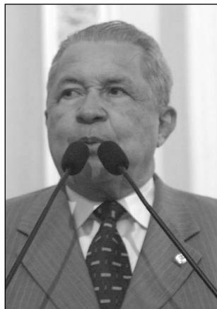
DEMOCRATA - Progresso