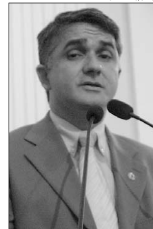
SOCIALISTA - Onze anos