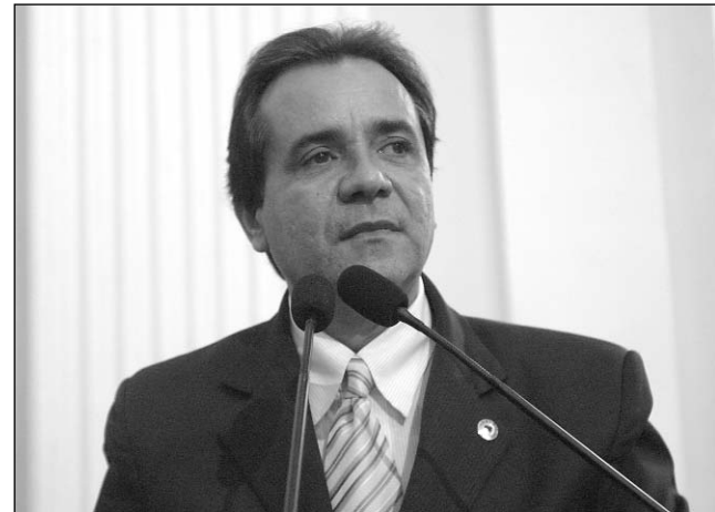
PARLAMENTAR - Desrespeito às normas do DER