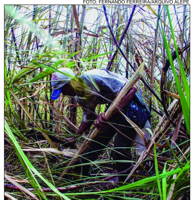
SEGMENTO - Atividade canavieira é responsável por um quarto dos casos registrados no País

Segundo a pesquisadora, cujos estudos focam a escravidão na Zona da Mata pernambucana, “a estrutura fundiária vigente no Brasil e em Pernambuco – latifundiária e de monocultura – agrava a desigualdade social e, portanto, a precarização do trabalho”. Não à toa, o meio rural reúne o maior número de casos de escravidão contemporânea, sendo a atividade canavieira – uma das mais relevantes para a economia do Estado – responsável por um