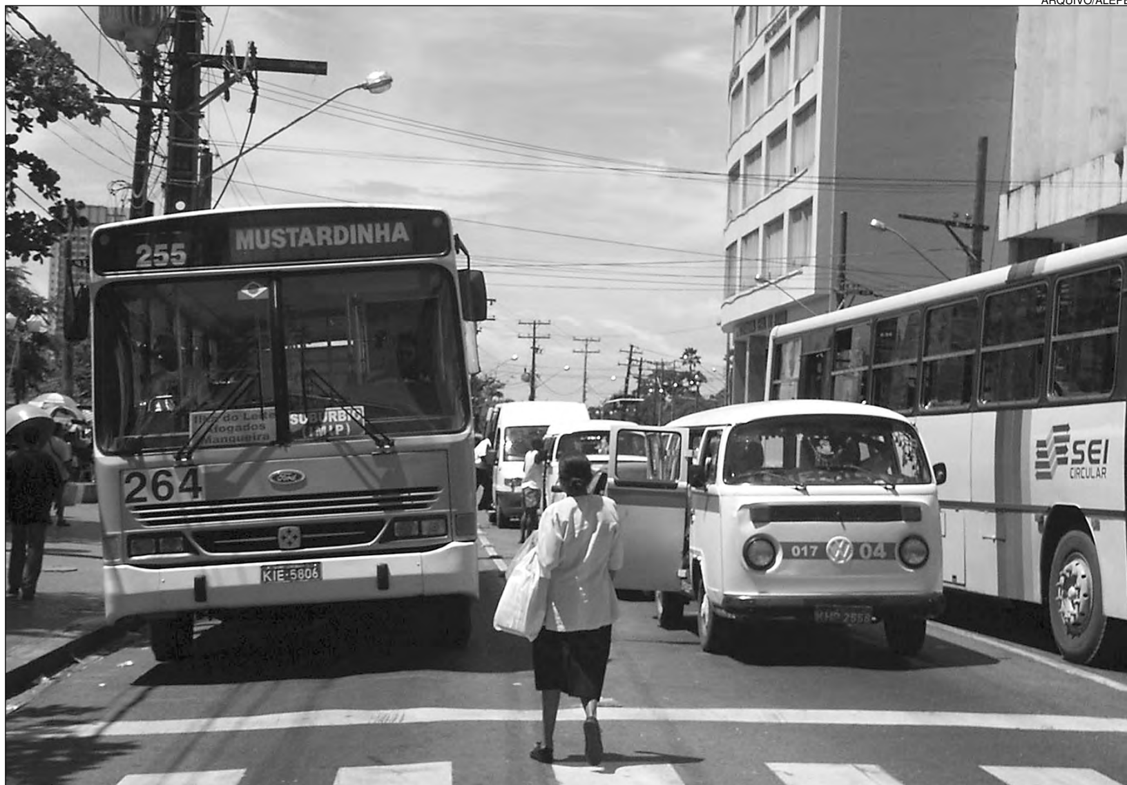
RENUNCIA - Executivo decidiu encaminhar ao Parlamento matéria ampliando benefício fiscal para veículos que integram a rede de transporte complementar

A partir de 1º de julho de 2010, o limite passou a ser 8.500.000 (oito milhões e quinhentos mil) litros/mês. A legislação determinou ainda que, a partir de 1º de agosto deste ano, fosse concedida a redução da alíquota do ICMS no abastecimento de combustível (diesel) para ônibus utilizados no transporte complementar de passageiros, respeitando os limites fixados pelo texto em vigor. A Lei nº 14.094 teve origem no Projeto de Lei nº 1.636/10, de autoria do Executivo Estadual.