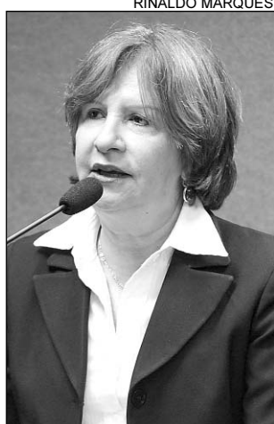
TEREZINHA - Aplausos

De acordo com a parlamentar, o engenheiro Ricardo Brennand colocou o Recife na rota das grandes exposições nacionais e in-