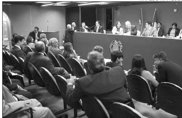
OPINIÃO - Governo e Oposição divergiram quanto ao texto