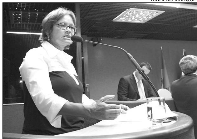
QUALIDADE - Nadegi aposta na melhoria do aprendizado

da hipertensão e do diabetes. Ainda serão disponibilizadas consultas nutricionais, odontológicas, oftalmológicas e auditivas, e as equipes do Programa Saúde da Família promoverão ações educacionais, a fim de incentivar a prática de atividade física e a alimentação saudável, além da prevenção ao uso de álcool, tabaco, drogas, gravidez e doenças sexualmente transmissíveis. “Duas vezes por ano, os profissionais da saúde vão medir e pesar as crianças, fazer exames auditivos e de vista e averiguar a saúde bucal”, destacou a parlamentar.