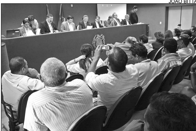
PRESERVAR - Diversas entidades participaram do debate

“Desde 2000, Suape conta com seu EIA/RIMA (Estudo de Impacto Ambiental/Relatório de Impacto Ambiental) e no documento era prevista a retirada de parte da vegetação. Porém, para cada supressão, a lei brasileira exige que, além de elaborar projeto de compensação, encaminhemos projeto de lei específico”, ponderou. Neste caso, a área de preservação sugerida pelo Estado para