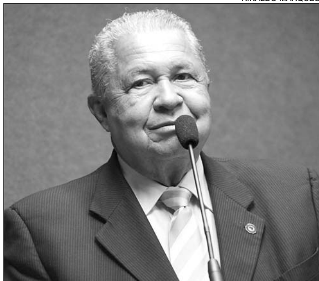
AMIZADE - Deputado citou trabalho em prol do Sertão