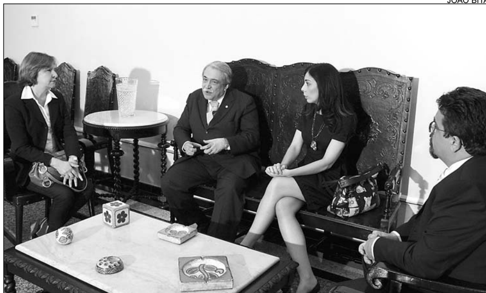
COMPROMISSO - Desembargador Jones Figueirêdo (E) pediu informações ao MPPE

O encontro foi um desdobramento da última audiência pública que o colegiado promoveu, no final do mês passado, para tratar o assunto. Helena Capela participou do encontro e informou que o MPPE in-