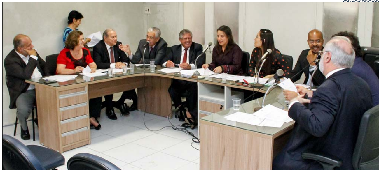
INICIATIVA - Serviço deverá adotar regras da Associação Brasileira de Normas Técnicas (ABNT) ou padrões internacionais

A proposição traz regras para todos os segmentos de uso de gás: residencial, comercial, industrial, veicular, termoeletrica e Poder Público. Critérios para a exploração, penalidades em casos de quebras contratuais e reajustes tarifários - que deverão ser anuais e homologados pelo Governo - também estão previstos na matéria.