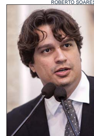
PROPOSTA - Calendário