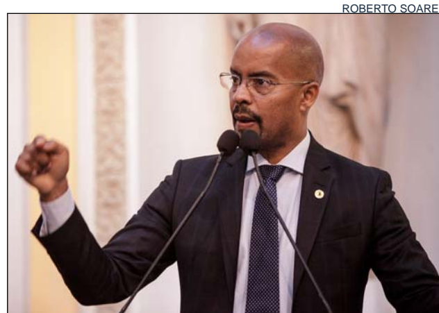
TRIBUNA - “É um desrespeito aos cidadãos e às instituições”