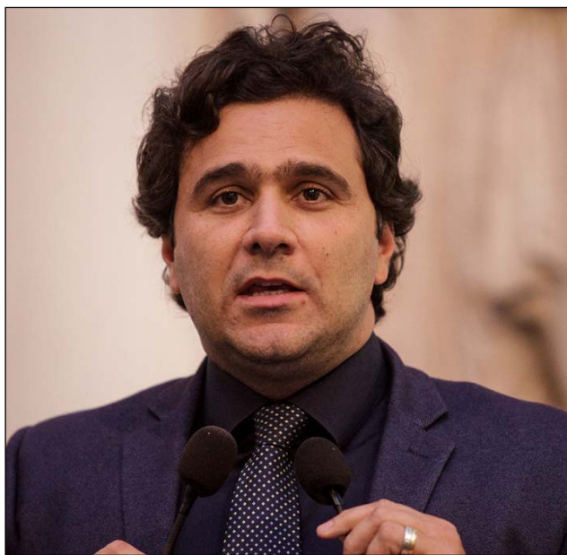
NOVAES - “Governador tem se reunido com gestores da segurança”