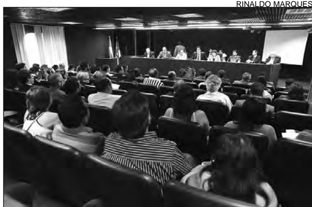
AUDITÓRIO - Deputados e profissionais participaram

O percentual, entretanto, não deverá ser menor que o mencionado durante o encontro. Isso porque, a oferta de bolsas para as áreas especificadas atende a uma das