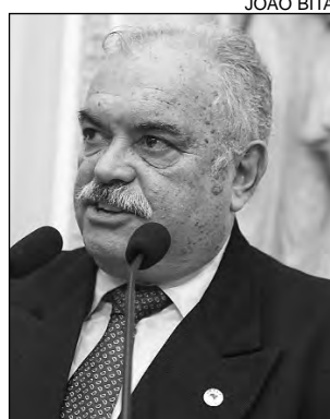
COSTA - Entusiasmo

A palestra reuniu empresários, profissionais de Carpina, Nazaré, Aliança, Timbaúba, Goiana, Vicência, Condado, além de radialistas, jornalistas, blogueiros, publicitários, estudantes, sindicalistas e políticos da região. A próxima audiência focará Educação e está agendada para o dia 15, no Parlamento Estadual, às 17h.