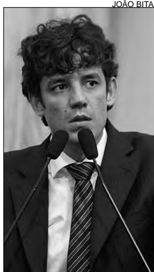
ALERTA - Usina nuclear