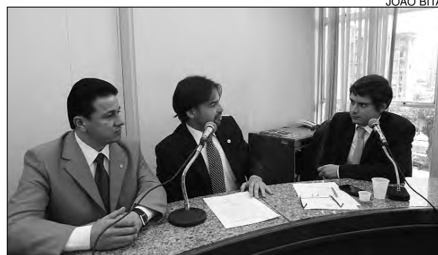
ANÁLISE - Projetos ligados à economia de Pernambuco