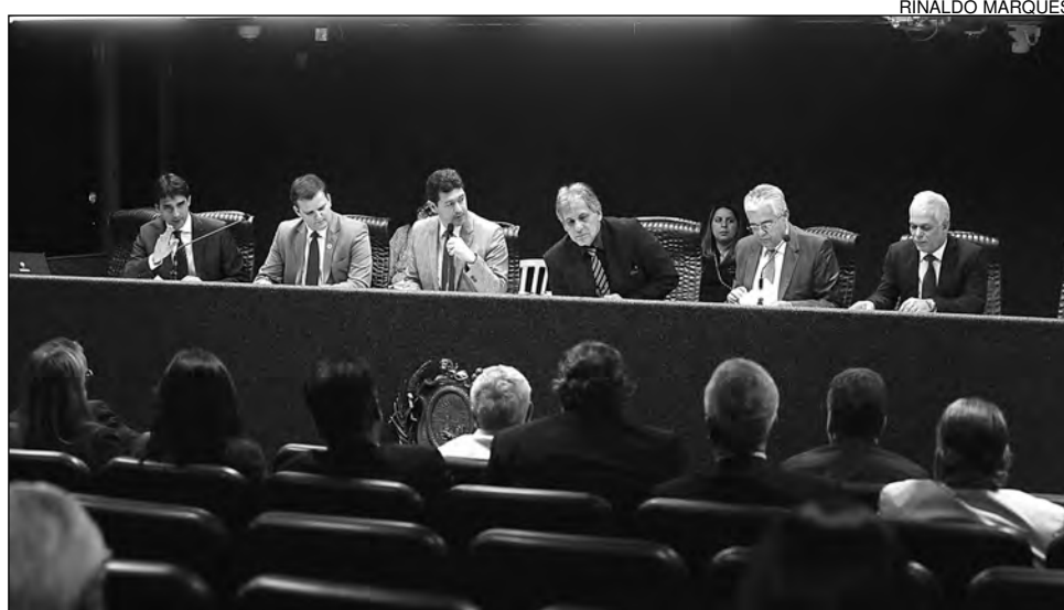
DEBATE - Consequências da crise na Polícia Federal foram assunto de reunião em 28 de maio

Como a comissão não dispõe de autoridade para ingressar com medidas judiciais, utiliza mecanismos como encaminhamento aos Centros de