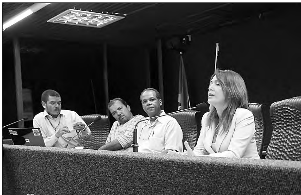
ANÁLISE - Deputada Elina Carneiro preside Comissão Permanente da Assembleia

A decisão de publicar o documento foi tomada durante audiência pública promovida para debater a violência de gênero em Pernambuco. O colegiado também promoveu um debate sobre a desigualdade da participação feminina no mercado de trabalho e repressou o Legislativo Estadual na Comissão de Enfrentamento à Violência Contra as Mulheres em Pernambuco.