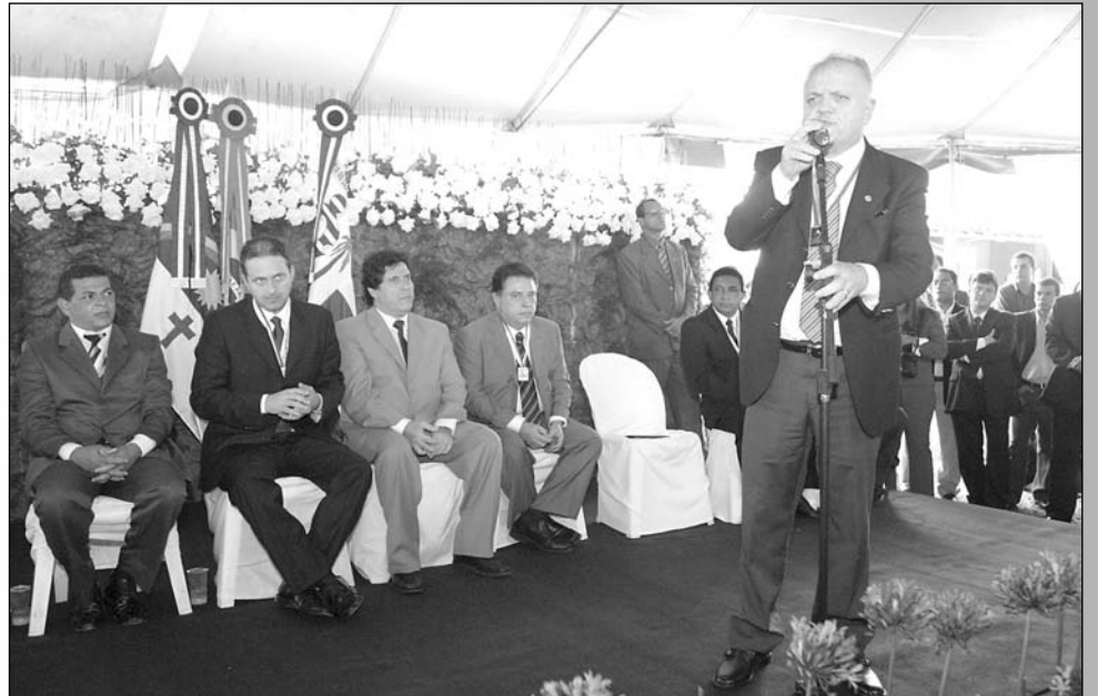
SOLENIIDADE - Presidente da Alepe falou sobre a importância de uma gestão democrática

O município do Cabo de Santo Agostinho tornou-se, ontem, a Capital administrativa de Pernambuco. A comemoração dos 130 anos de emancipação política da cidade teve como ponto alto a instalação dos Poderes Executivo e Legislativo. O evento foi aberto em frente do Palácio Conde da Boa Vista, onde o prefeito Lula Cabral recebeu o governador Eduardo Campos e o presidente da Assembleia Legislativa, deputado Guilherme Uchoa (PDT). No local, também estavam presentes o prefeito do Recife, João Paulo, deputados federais, estaduais, vereadores e secretários.