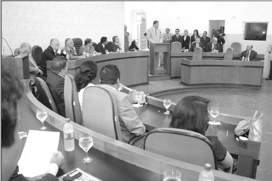
LEGISLATIVO - Poder foi instalado na Casa Vicente Mendes, sede da Câmara Municipal