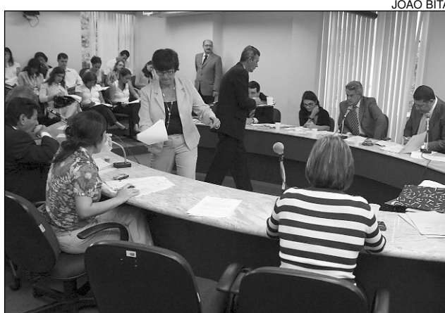
COLEGIADO - Deputados querem dinamizar Estado

A Secretaria de Educação e a Empresa de Turismo de Pernambuco (Empetur) tam-