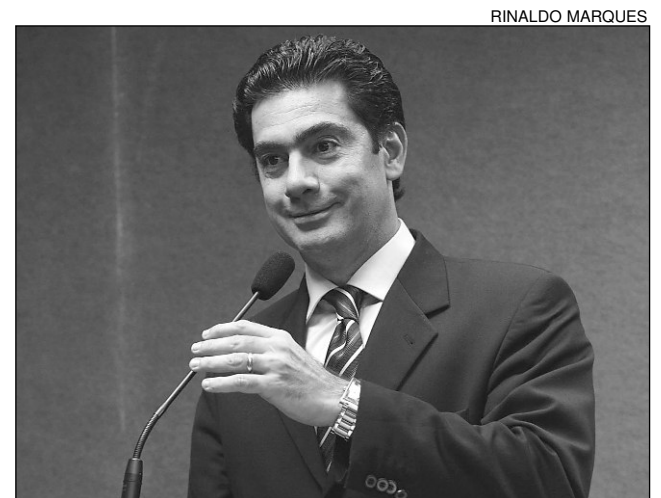
PIMENTEL - Volume de negócios chegou a R$ 1,5 milhão

A Associação Brasileira da Indústria do PET (Abipet) explica, no site da instituição, que PET - poli tereftalato de etileno - é um poliéster, polímero termoplástico. Simplificando, é o melhor e mais resistente plástico para fabricação de garrafas e embalagens. O PET proporciona alta resistência mecânica (impacto) e química, além de barrar gases e odores. As embalagens PET são 100% recicláveis e sua composição química não libera nenhum produto tóxico.