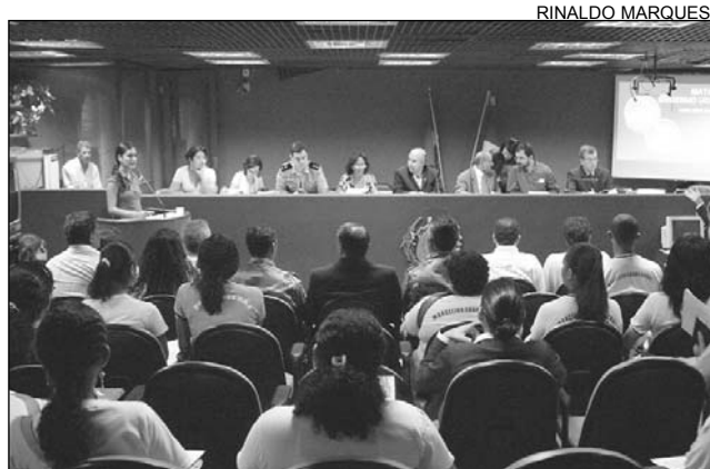
AUDITÓRIO - Entidades detalham processo de negociação

Técnicos presentes na audiência pública afirmaram que a preservação desse espaço é de vital importância para o Recife, não apenas por ser a maior área verde na cidade, chegando a ocupar 1% da extensão da Capital, como também por estar localizada em um desnível. Este último fator é preocupante porque, se houver desmatamento, as comunidades ao redor serão prejudicadas. A mata se localiza às margens da BR-101 Sul e da Avenida