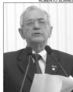
BENEFÍCIO - Servidor