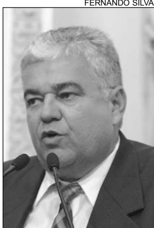
INVASÃO - Preocupante

Moraes citou a lei que assegura que propriedades invadidas não sejam objeto de Reforma Agrária e disse que o Executivo Federal não está cumprindo a legislação. "Uma das promessas do Go-