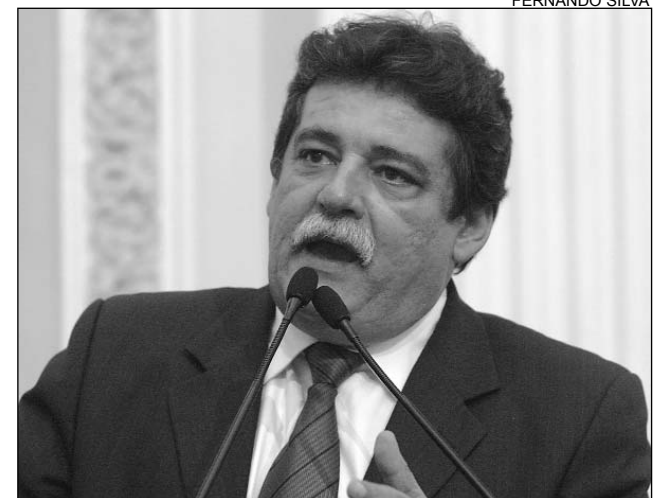
DEMORA - Governo Jarbas iniciou intervenção há seis anos

mento foi o primeiro de uma série que será feita na Assembléia para alertar a população sobre os motivos pelos quais "não se deve votar" em Jarbas Vasconcelos para o Senado, nas próximas eleições. "A cada dia, apresentarei um motivo para explicar porque Jarbas nunca mais deve receber o voto de um pernambucano", destacou.