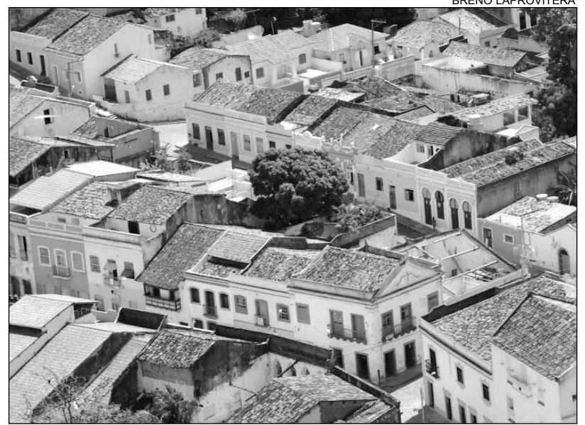
CASARIOS - A arquitetura histórica da Marim dos Caetés