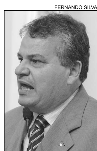
LEANDRO - PMs são alvo

"Acompanharemos o andamento das investigações e exigiremos que os culpados sejam afastados de seus cargos e punidos devidamente. Encaminhamos, hoje