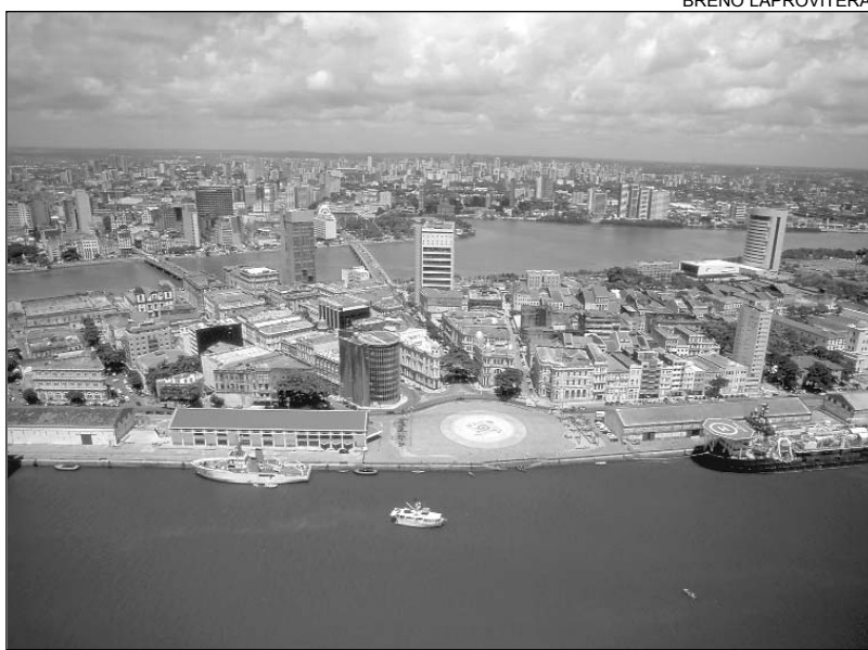
VISTA AÉREA - Marco Zero e Cais do Apolo, na Veneza brasileira

Com 40 quilômetros quadrados e 400 mil habitantes, Olinda foi classificada por Jacilda como um lugar plural, pois, "ao lado de um ambiente telúrico, há graves problemas sociais". A peemedebista lembrou que o município foi palco das primeiras encenações teatrais no Brasil, realizadas no Colégio Jesuíta, atual seminário de Olinda. A Marim dos Caetés também abrigou