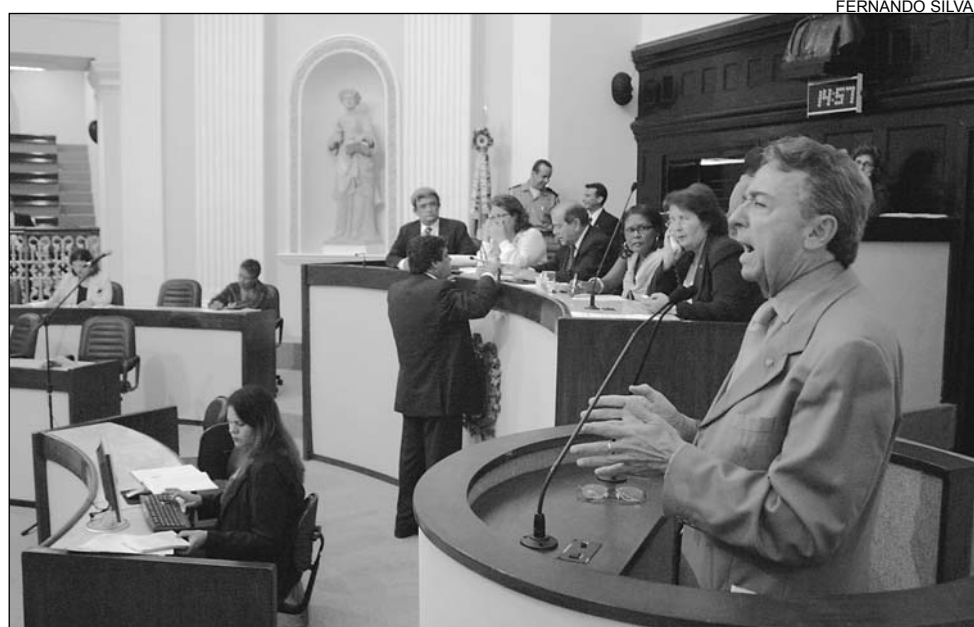
DOMÉSTICO - Para o deputado, respeito ao sexo feminino começa em casa

Queiroz ainda se mostrou preocupado com a violência contra o sexo feminino no Estado. "Do início do ano até agora, foram registrados 75 homicídios. Isso provoca revolta em quem tem uma postura de admiração pelas mulheres. O registro do dia 8 só ocorre porque ainda