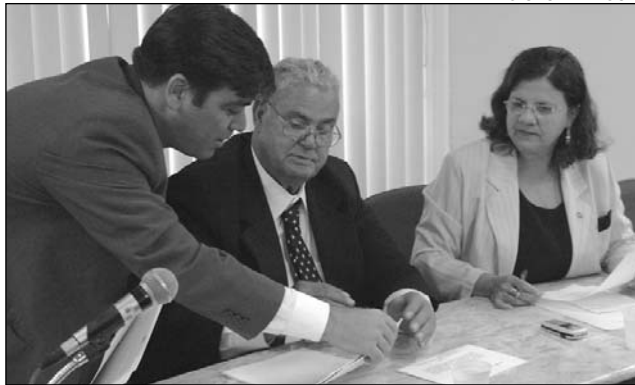
VERBAS - Teresa destacou recursos do Governo Federal

A Comissão de Educação também vai atender à solicitação de vestibulandos que querem discutir a ocupação de vagas por estudantes apro-