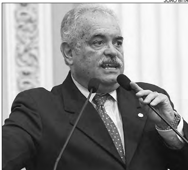
COSTA – Visita acompanhado de secretário de Transporte

Empresa responsável afirmou que cronograma é viável