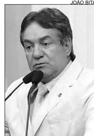
RÉGIS – Viagem a Brasília

“Muitos prefeitos são processados pelos Tribunais de Contas da União e do Estado porque as obras iniciam, a Caixa não manda engenheiros para fiscalizar e orientar, causando demora na conclusão das construções. Os gestores tentam fazer o certo; os tribunais entendem como errado e os processa”, lamentou. O petebista declarou acompanhar, anualmente, a aplicação de verbas e incentivou os demais parlamentares a fazer o mesmo nas regiões que representam.