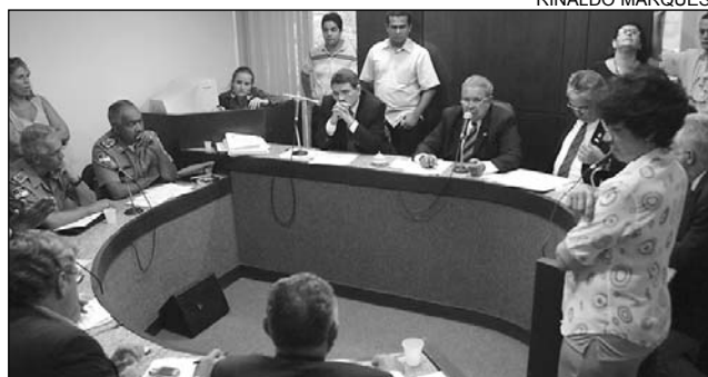
FINANÇAS - Pauta de proposições em tramitação foi zerada

A outra proposta autoriza o Tribunal a utilizar, excepcionalmente, para despesas com pessoal, o montante de até R$ 15 milhões dos recursos arrecadados com taxas, custas judiciais e emolumentos. De acordo com o projeto, o uso da verba é necessário para que o Poder Judiciário