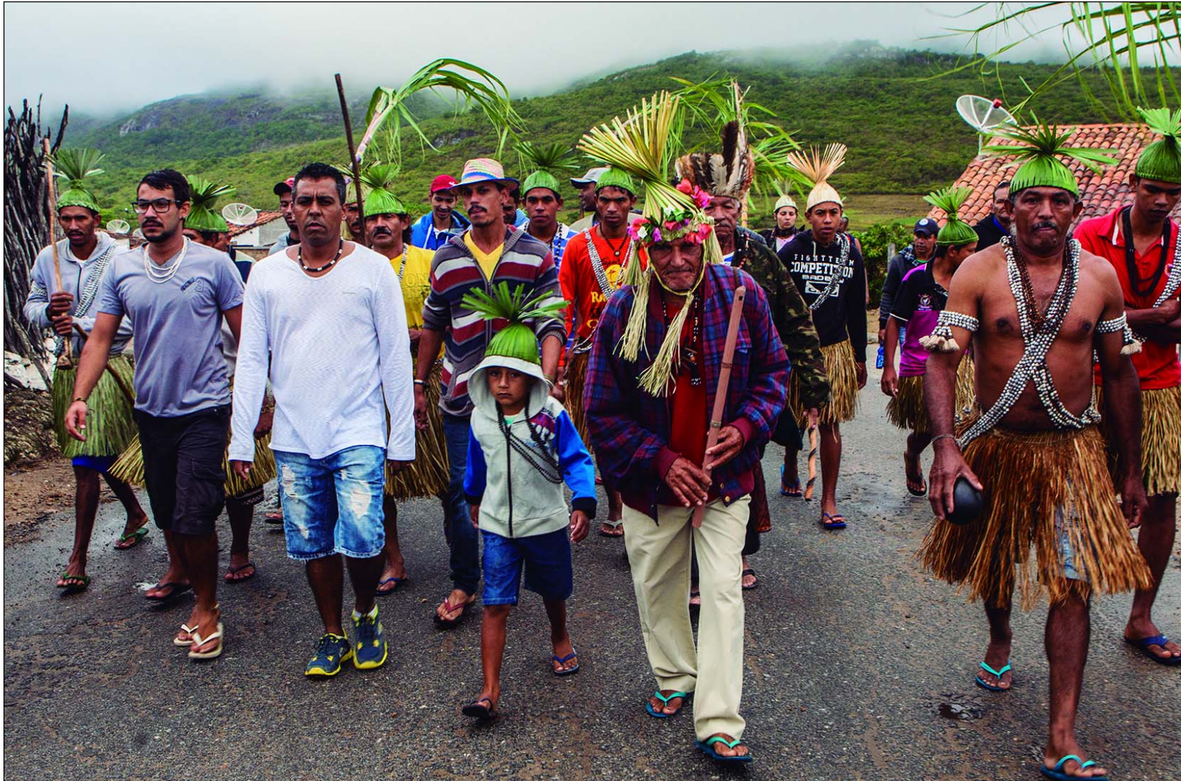
Uma vez por ano, Xukurus do Ororubá caminham por aldeias de Pesqueira em direção à igreja da Vila de Cimbres