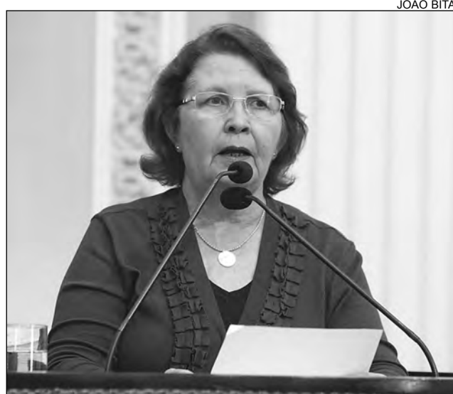
RMR - Jacilda voltou a mencionar transtornos em Olinda

Para agravar a situação, a Compesa realizou uma