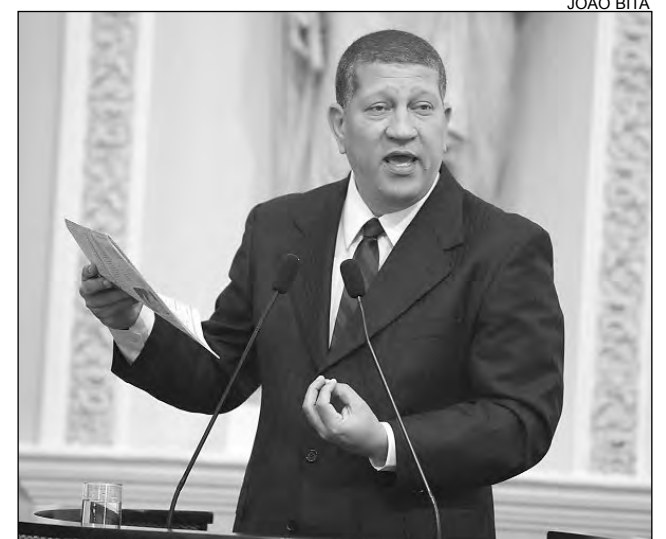
NASCIMENTO - Autor da medida detalhou importância

O petista requereu, ainda, que a Mesa Diretora da Assembleia Legislativa envie um ofício aos jornais pernambucanos, com o intuito de que as publicações fiquem mais atentas em relação à autoria das propostas.