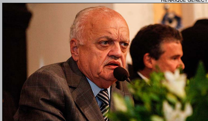
Uchoa ressaltou que "aqueles que tiveram a satisfação de conhecê-lo também sabem que foi construindo pontes, promovendo diálogos e discutindo ideias, que Marco Maciel fez a verdadeira e boa política ao longo dos últimos 50 anos".