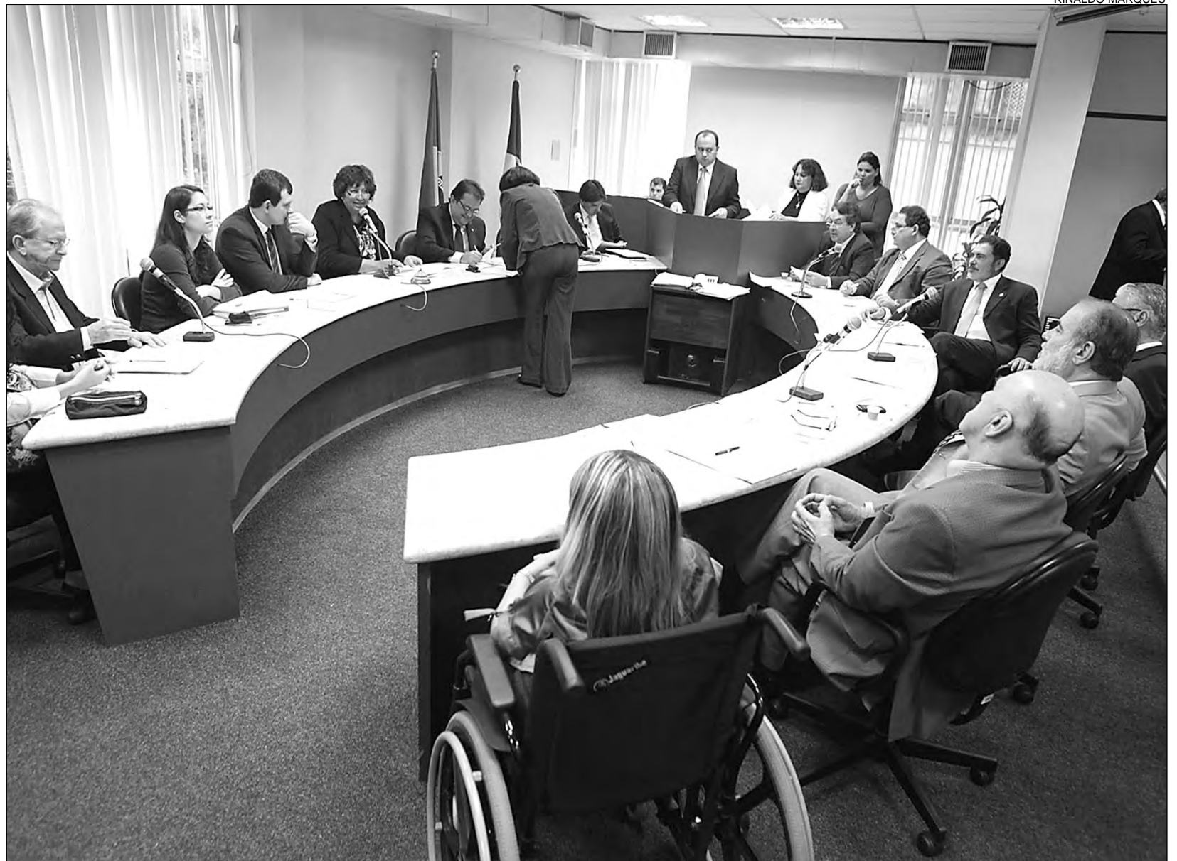
PRONTUÁRIO MÉDICO - Audiência aborda polêmica entre profissionais quanto à entrega do documento a pacientes ou familiares

O colegiado também acatou a definição de datas