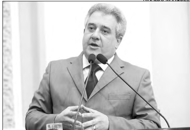
COUTINHO - Avanços contra morosidade do Judiciário