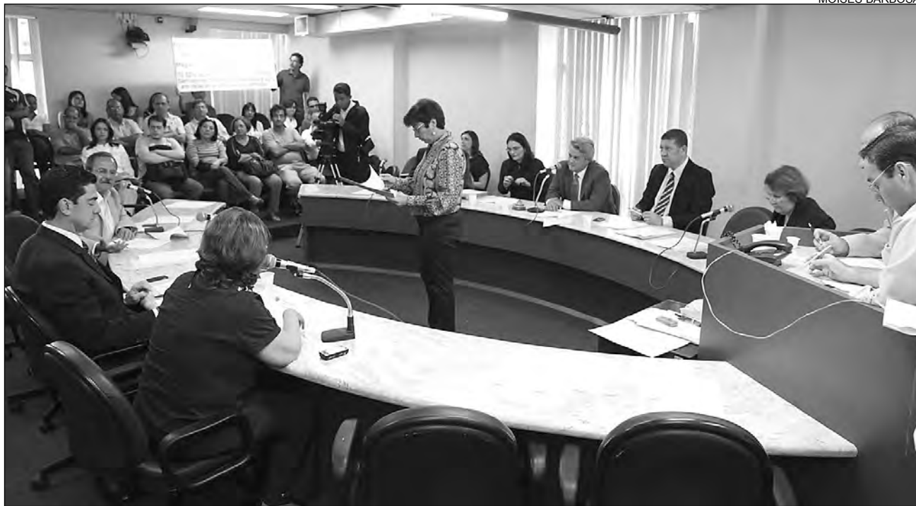
COLEGIADO DE JUSTIÇA - Integrantes da Comissão emitiram parecer favorável à ideia do líder da Oposição na Casa

A proposta também estimula a realização de acordos e conciliações e prevê a uniformização do processo eletrônico, facilitando o recebimento de comunicações. O novo Código de Processo Civil (CPC) tem 970 artigos, 250 a menos que o atual. O texto ficou enxuto porque a proposta definirá um procedimento geral que garantirá poderes aos juízes para adaptá-lo diante do caso concreto, em vez de tratar de cada particularidade do processo.