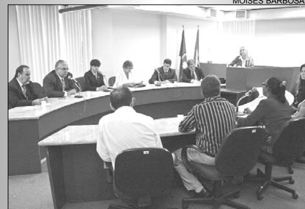
SAÚDE - Zona da Mata concentra número de vítimas