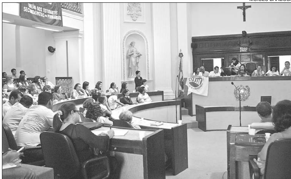
PRAZO - Até 2014, todas as unidades de Ensino Fundamental adotarão novo modelo