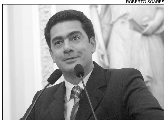
TRINDADE - Deputado pediu Voto de Aplausos para prefeito

A Emenda Constitucional nº51, de autoria do deputado federal Maurício Rands (PT) e aprovada pela Câmara Federal, ano passado, possibilitou a regulamentação da profissão e o reconhecimento dos direitos trabalhistas. "Muitos com até 13 anos de serviço prestado não tinham qualquer garantia trabalhista", ressaltou o segundo secretário da Casa, convo-