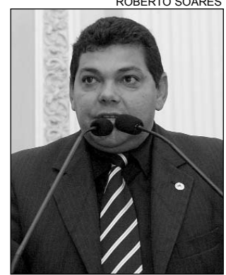
FIGUEIRÔA - Potencial

O potencial turístico da cidade de Santa Cruz do Capibaribe vai ser exibido no próximo sábado (12), no Programa Caminhos do Nordeste da TV Globo. "Existe, na região, um grande fluxo de pesquisadores, arqueólogos, geólogos, estudantes universitários e professores que é atraído pelo valor histórico-cultural dos pontos turísticos. Um dos exemplos é o Cruzeiro, marco religioso com cerca de quatro metros de altura, erguido sob uma base de alvenaria, onde está a imagem de São Sebas-