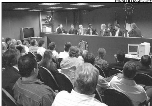
AUDIÊNCIA - Colegiado ouviu o diretor da Embrapa