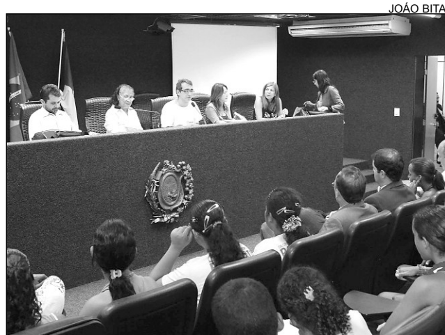
CONSCIENTIZAR - Orientar população é um dos desafios