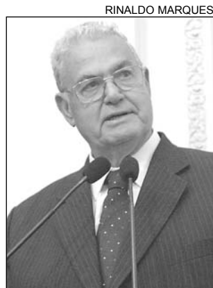
COELHO - Petrolina

Selecionados entre concorrentes de todo o Brasil, dois sargentos do Exército irão para os Estados Unidos participar de um curso militar a convite do país norte-americano. Um deles é de Petrolina, Sertão de Pernambuco. A informação foi dada, ontem, pelo deputado Geraldo Coelho (PTB), durante pronunciamento no Pequeno Expediente. De acordo com o parlamentar, o sar-