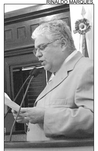
MORAES - História

Timbaúba fez festa, ontem, para comemorar os 129 anos de emancipação política. Localizado na Zona da Mata Norte, o município vive atualmente, segundo o deputado Antônio Moraes (PSDB), um período de grande crescimento econômico com o soerguimento do Pólo Calçadista. “Como representante parlamentar de Pernambuco e, especialmente, da cidade, não poderia deixar de parabenizar a população e o prefeito Bartolomeu Ferreira pela data”, frisou.