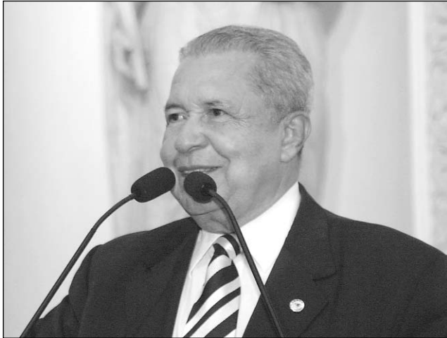
RUFINO -Parlamentar quer realizar reunião solene