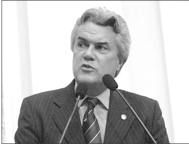
CAMPOS - Detalhes sobre a vida pública do homenageado