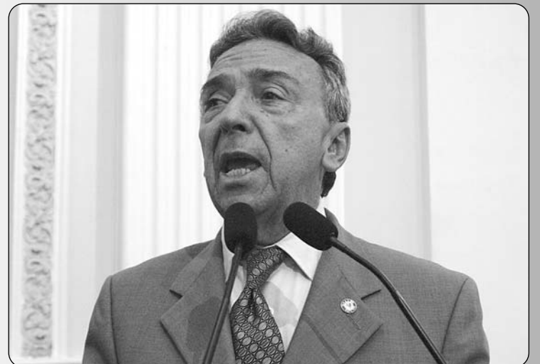
ARTICULAÇÃO - Queiroz sugeriu parcerias com outras entidades