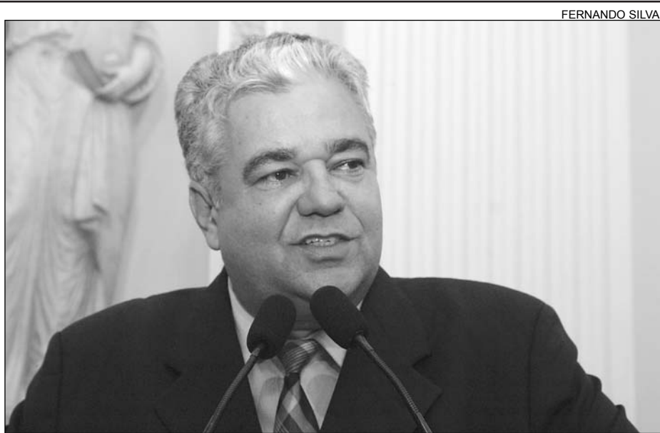
PROPOSTA - Moraes disse que ação custeia o tráfico de drogas e de armas