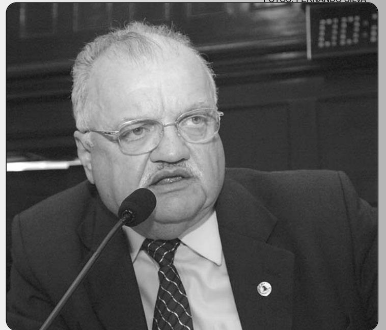
UCHOA - Presidente quer veicular iniciativas dos parlamentares no Interior