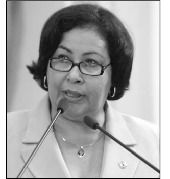
AURORA - Comemoração

As inaugurações da nova Agência do Trabalho e da Unidade de Trabalho Regional do Projeto Renascer (UTR), em Garanhuns, no último dia 30, foram ressaltadas, ontem, pela deputada Aurora Cristina (PMDB). "Trata-se de uma importante ação do Governo do Estado, que atendeu à reivindicação do ex-prefeito Silvino Duarte, que foi intensificada por mim ao chegar a esta Casa."