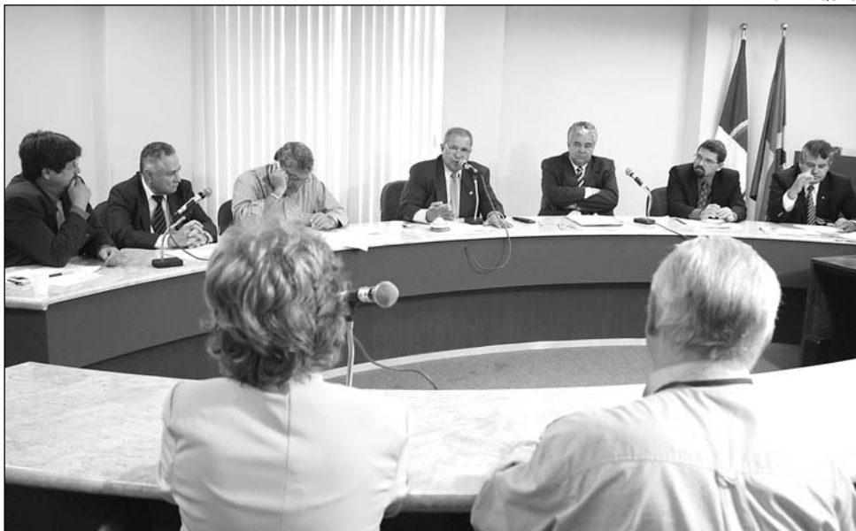
POLÊMICA - Uma das matérias retira verbas de obras hídricas da zona rural