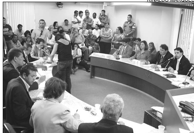
UNÂNIME - Colegiado aprovou iniciativa em reunião

ciativa de lei e vamos gerir a Defensoria. O próximo passo é conseguir o nosso orçamento. Vamos negociar com o Governo eleito para que os recursos sejam compatíveis com as nossas necessidades, visando garantir melhorias no atendimento para o povo pobre de Pernambuco", afirmou.