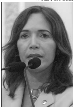
ELINA - Resultados obtidos

A parlamentar elogiou a homenagem a Maria da Penha, por sua história e coragem, e convidou os presentes para seminário que o colegiado realizará, em 22 de setembro, pela passagem do primeiro ano da lei. "Será um momento de comemoração e, principalmente, de reflexão, debate e enga-