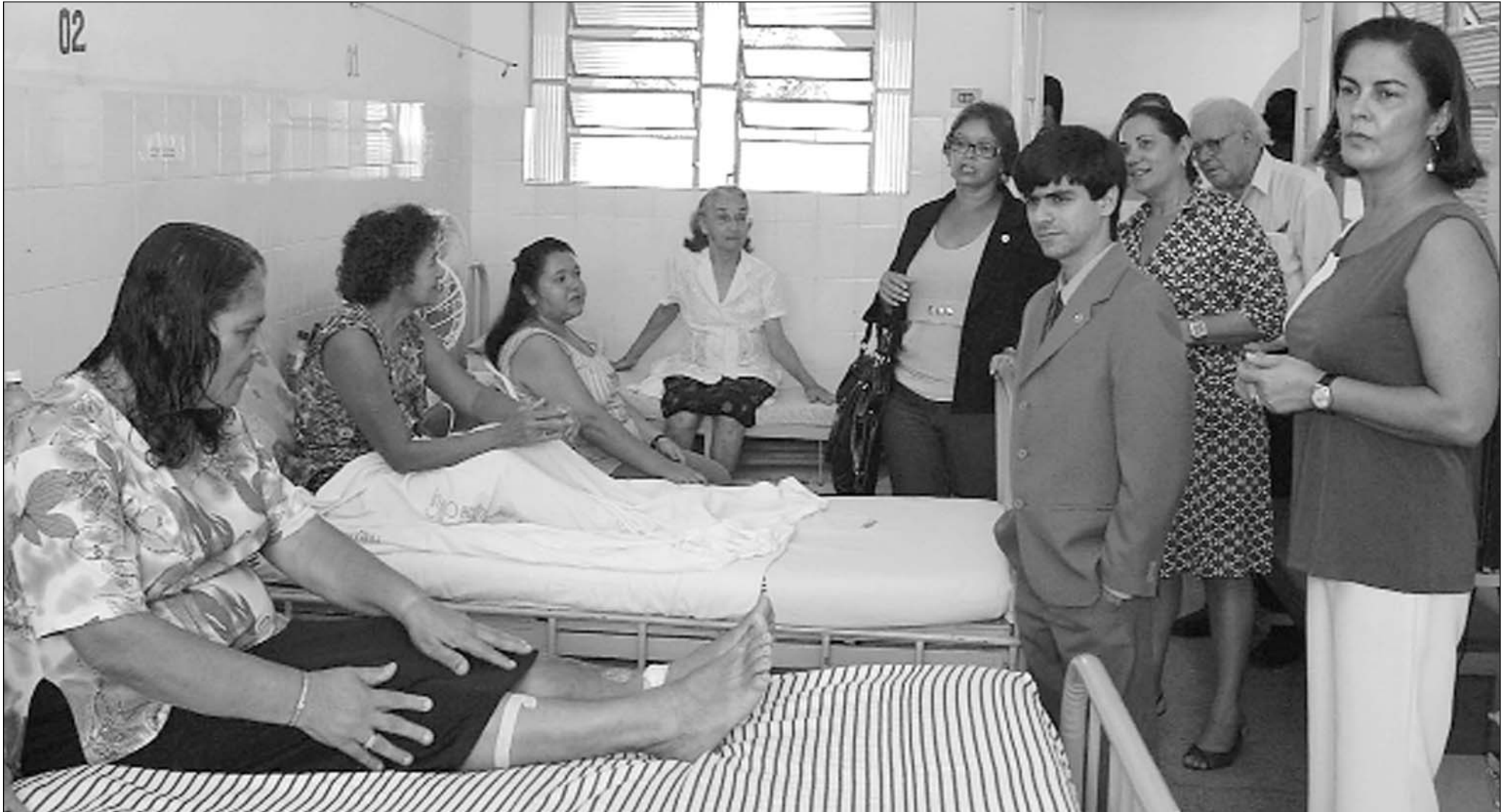
BEZERROS - Parlamentares ouviram pacientes do Hospital Jesus Pequeno. Unidade propôs firmar parceria com Estado e município, a fim de oferecer mais leitos