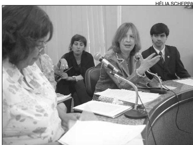
DISTRIBUIÇÃO - Proposta está na Comissão de Cidadania

De acordo com a proposta, a via de pagamento destinada ao estabelecimento deverá constar o número do documento de identidade. Na falta do RG, poderá ser apresentado outro documento de identificação com foto. Caso o cliente se recuse a atender a solicitação, as empresas e estabelecimentos comerciais e financeiros poderão desfazer a venda do produto ou a prestação do serviço ou exigir outra forma de pagamento.