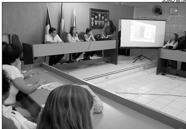
AGENDA - No dia 29, colegiado seguirá para Maraial

Estudos do Departamento Intersindical de Estatísticas e Estudos (Dieese) apontam