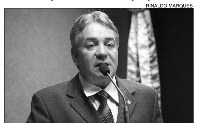
RÉGIS - Falta apenas autorização do governador do Estado

O petebista ainda agradeceu ao presidente da República, Luiz Inácio Lula da Silva, porque o Ifet estava previsto para 2010, mas a construção foi antecipada para 2008.