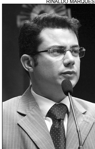
APOIO - Magalhães

"A ação é bem-vinda, pois busca humanizar o