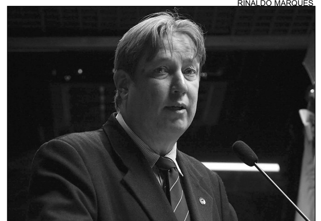
RISCO - Gravidez na adolescência preocupa deputado

A escolha do público-alvo levou em consideração o fato de os jovens iniciarem a vida sexual cada vez mais cedo. "Não é raro nos depararmos com crianças gestantes. A vacina tem efi-