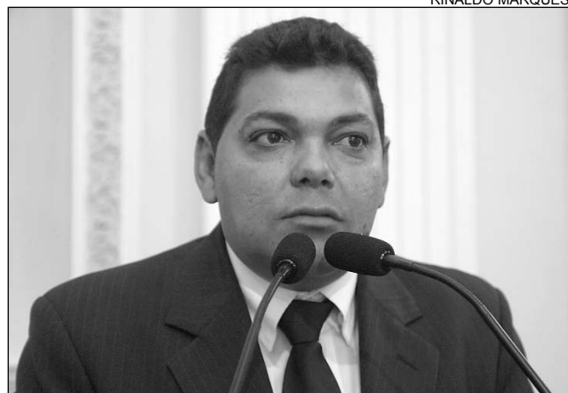
FIGUEIRÔA - Apoio à proposta do Poder Executivo

Região Metropolitana e do Interior do Estado que serão beneficiados com os kits escolares já receberam o material e a previsão é que, até o dia 10 de junho, todos estejam usufruindo o benefício. “O governador Eduardo Campos está demonstrando empenho para garantir ensino de qualidade. Apesar dos investimentos em outras áreas, vejo Eduardo trabalhar para viabilizar, por meio da educação, o Pernambuco para Todos que ele tanto defende”, afirmou.