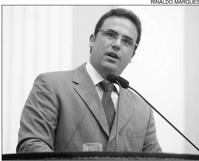
INSPIRAÇÃO - Socialista também reverenciou o pai