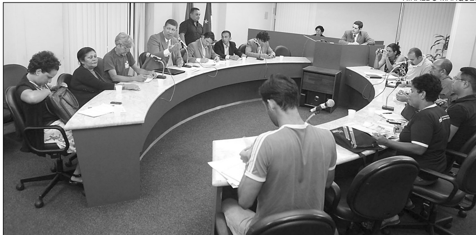
SEMESTRE - Grupo de trabalho anunciou ações que serão desenvolvidas até o mês de junho

Em maio, outra audiência trará o conteúdo do Projeto de Lei Complementar nº 122, em tramitação no Congresso. A matéria define a punição de crimes por homofobia. A discussão pretende pressionar os parlamentares federais a votar a medida. O debate está marcado para o dia 10 de maio, às 9h, na Câmara Municipal do Recife, que