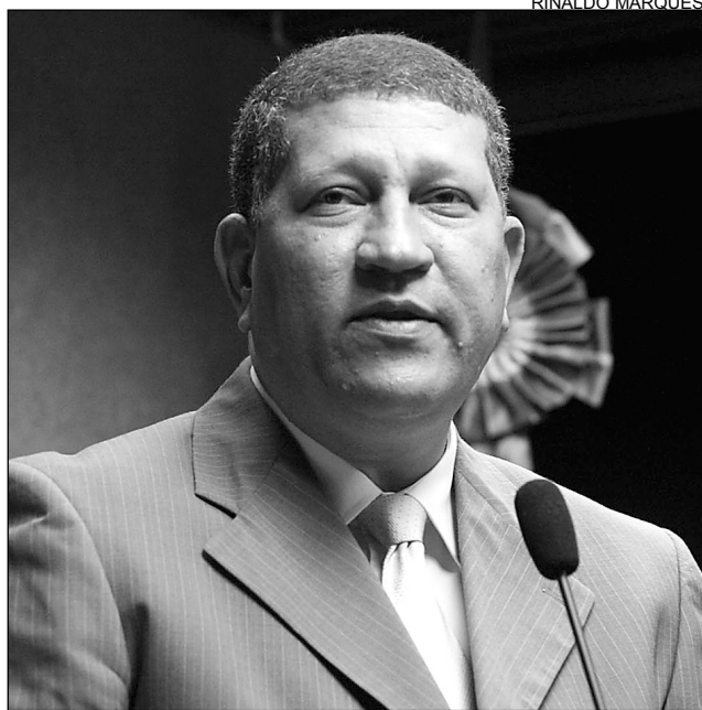
NASCIMENTO - Atividade é fundamental para democracia

O parlamentar defendeu o apoio à categoria que luta pela manutenção do diploma e convidou os deputados para se unirem ao movimento. O petista informou que, na próxima semana, circulará na Casa um manifesto em defesa da imprensa livre e do respeito aos profissionais. “Com todas as assinaturas recolhidas, enviaremos o documento aos órgãos competentes. Lembramos que a sociedade não pode compactuar com um mero desejo de empresários e ir de encontro ao livre exercício profissional do jornalista”, argumentou. A dúvida surgiu quando um grupo de empresas de rádio e de TV de São Paulo questionou ju-