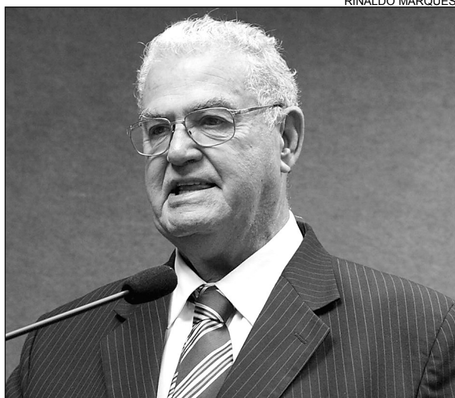
TECNOLOGIA - Coelho enalteceu qualidade do periódico

De acordo com o parlamentar, o veículo promove constantemente ações que