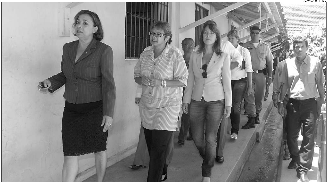
ESPAÇO - Colegiado apurou que, atualmente, 518 detentas ocupam unidade criada para abrigar apenas 150 presas