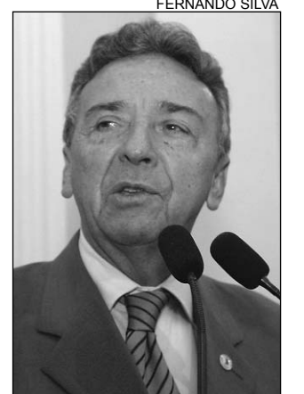
DUPLICAÇÃO - BR-104