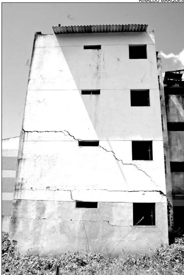
PREOCUPAÇÃO - Prédios caixão têm apresentado falhas

Além dos tópicos citados acima, outras três medidas fazem parte das novas exigências. Rede de fornecimento de energia elétrica pública e domiciliar, iluminação em todas as ruas e sistema de coleta e tratamento de esgoto sanitário completam a lista técnica para a realização de qualquer construção popular a partir de dez edificações. Para serem liberadas, as obras deverão passar por