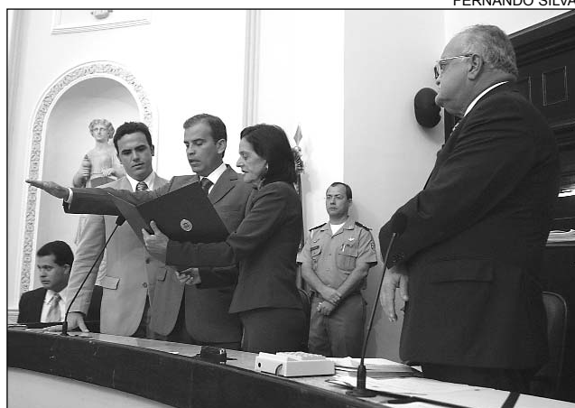
JURAMENTO - Compromisso com o desenvolvimento