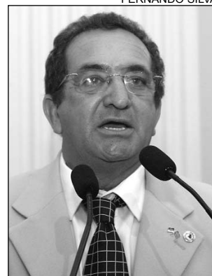
BRINGEL - Incentivo

"Essa iniciativa é um avanço. Teremos acesso aos acontecimentos da Capital e do nosso Estado. A maioria da população de Araripina está perdendo o vínculo cultural