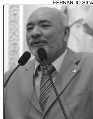
PROMESSA - Trabalho

"Superando minhas limitações, espero me esforçar bastante no propósito de