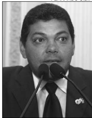
SUGESTÃO - Figueirôa

O estudo técnico que será realizado sobre as prioridades da região Agreste, tomando como base o Pólo de Confecções, foi citado na tarde de ontem pelo deputado Antônio Figueirôa (PTB). "A iniciativa das prefeituras em analisar as principais necessidades de cada município é importante para que o governador Eduardo Campos (PSB) elabore um diagnóstico e busque alternativas