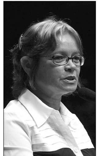
NADEGI - 6,6 mil postos

A raiva é uma doença que apresenta letalidade de 100%. Apesar de ser mais comum a transmissão da virose por meio dos cães, os humanos também podem ser infectados por gatos, bois e, até mesmo, por animais silvestres como morcegos, raposas e macacos. O vírus rá-