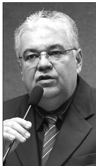
COMPROMISSO - Moraes

Na avaliação do parlamentar, o comunicado de Obama aos americanos e ao mundo cria a expectativa de que o novo governo utilizará a negociação e o en-