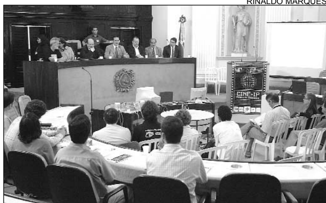
DESTAQUE - UFPE esteve na final do Imagine Cup